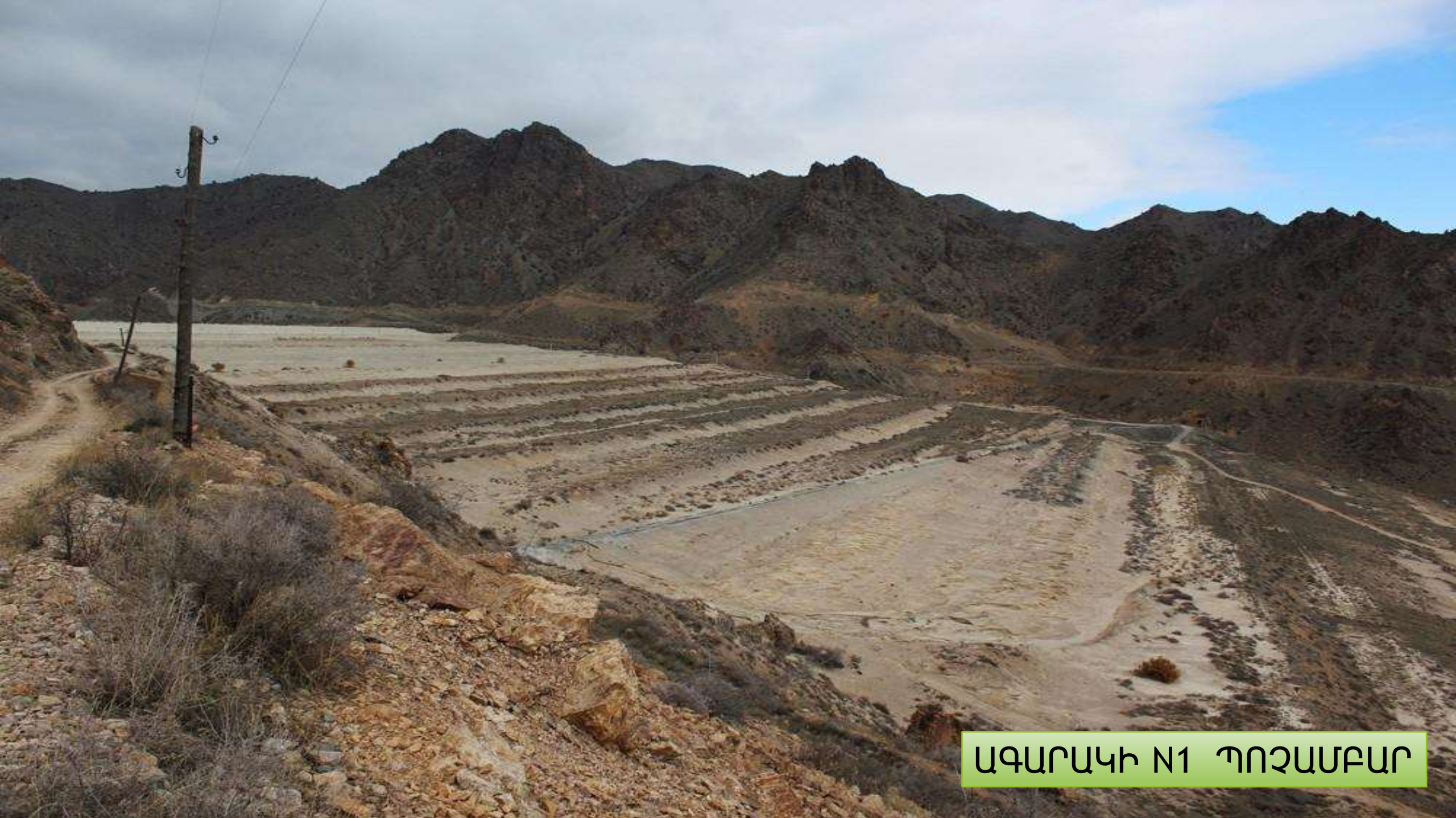
ԱԳԱՐԱԿԻ N1 ՊՈՉԱՄԲԱՐ